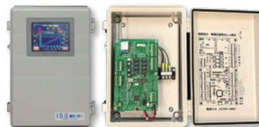
新開発の強力無線制御ユニットと装置

導入が進む中、新たな課題も出てきました。製品は低価格でも導入時には配線等の工事費がかさむこと、また、電力抑制・削減の情報把握にはネットワーク接続が必要でした。そこで新事業として「無線装置の開発とWEB閲覧機能ソフトの開発」をスタート。商工会に相談したところ「ものづくり補助金」が活用できるとわかり、その支援を受けて配線工事の必要がない最新のデマンド・コントローラーを開発。より使いやすく低コストで導入できるようになりました。